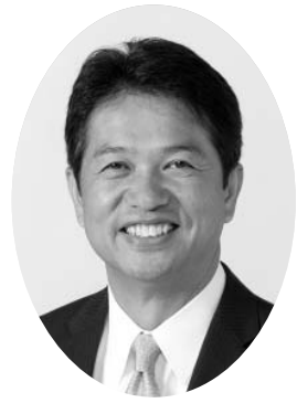
茨城県知事 大井川和彦