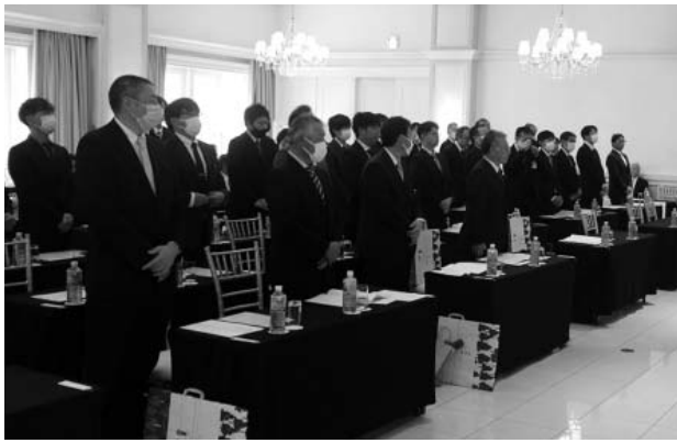
受賞された会員の皆様